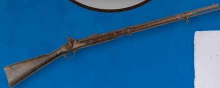
エンフィールド銃